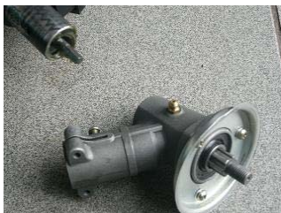
Masivní úhlová převodovka