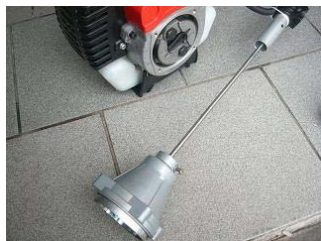
pevná hnací hřídel