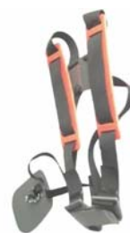
Pohodlný čalouněný 3-bodový popruh