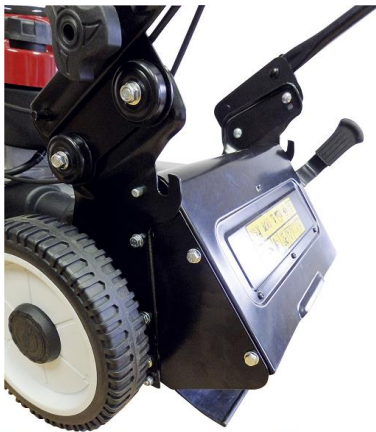
Profesionální nastavba zadního výhozu.