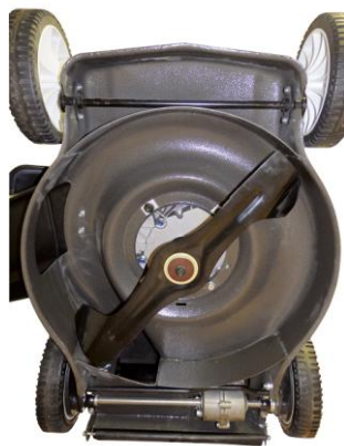
Masivní nůž "bigblade" s třecí spojkou nože.