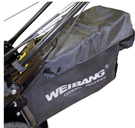
Velký sběrací koš s protiprachovou úpravou