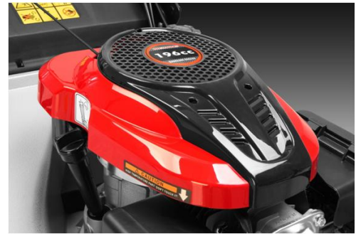
Silný OHV motor Weibang 7 HP