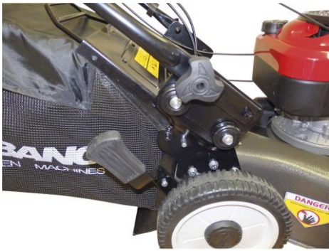
Antivibrační uložení řidítek AVS